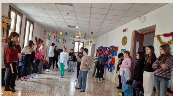
Prove di recitazione