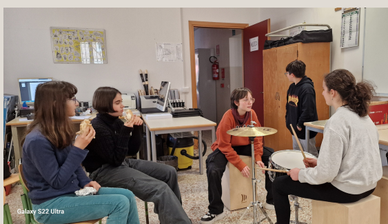
Le nostre pause