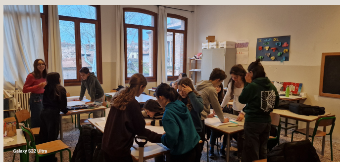
Scenografi a lavoro